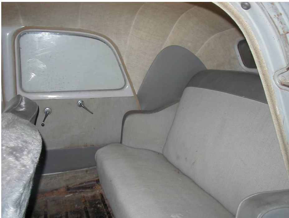
So sah der Originalzustand in meinem Baujahr 1955 aus